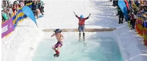
WATER SLIDE SKI