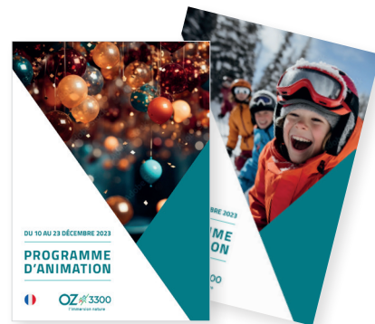
PROGRAMME D'ANIMATION BIMENSUEL