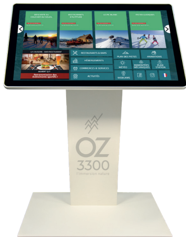
ÉCRANS ET TABLETTES NUMÉRIQUES